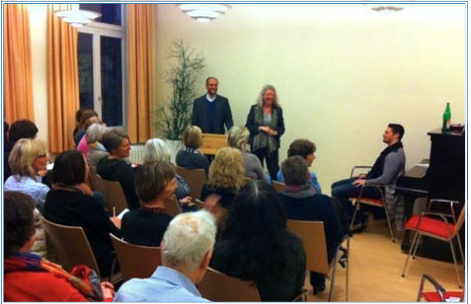
Großes Interesse beim Vortrag „Schmerzen aus islamischer und philosophischer Sicht“

seelische und körperliche Gesundheit zu kümmern und uns als die Person zu entfalten, die Gott in seiner Vollkommenheit geschaffen hat. In diesem Sinne gehören Entwicklungsschritte und Schmerzen zusammen.