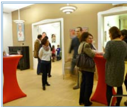
Gäste bei der Vernissage der Ausstellung „Vom Leben ins Leben“

Trauer und Wut, und schließen einander nicht aus.