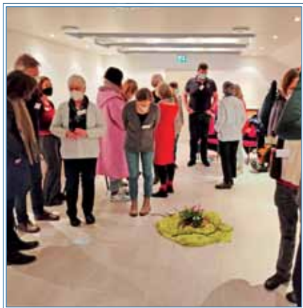
Die Gruppe beim ersten Kursabend

Das Gefühl zur Pioniergruppe des neuen Hospizes zu gehören fühlt sich großartig an. Irgendwie nach Auf-